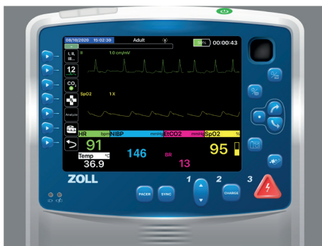
Ecran d'apparence du moniteur/défibrillateur "Zoll® Propaq® MD" Réf. Article 8000978

REALITi360 simule fidèlement une importante variété de moniteurs, de défibrillateurs et d'écrans de respirateurs.