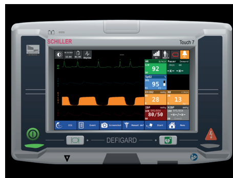
Ecran d'apparence du moniteur/défibrillateur "DEFIGARD Touch 7" Réf. Article 8001000