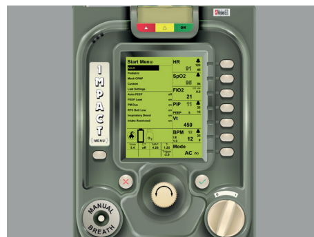
Ecran d'apparence du respirateur "ZOLL EMV+®" Cat. N° 8001016