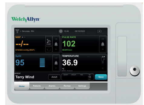
Ecran d'apparence du moniteur "Connex® VSM 6000" Réf. Article 8000977