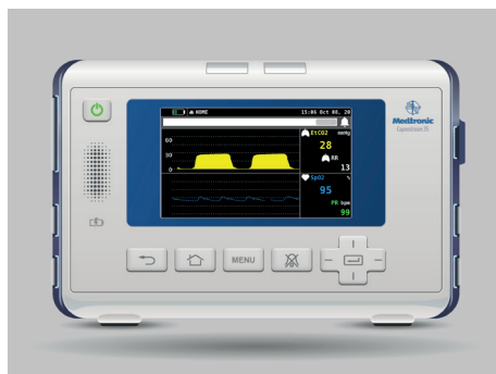
Ecran d'apparence du moniteur "Medtronic Capnostream™ 35" Réf. Article 8000973